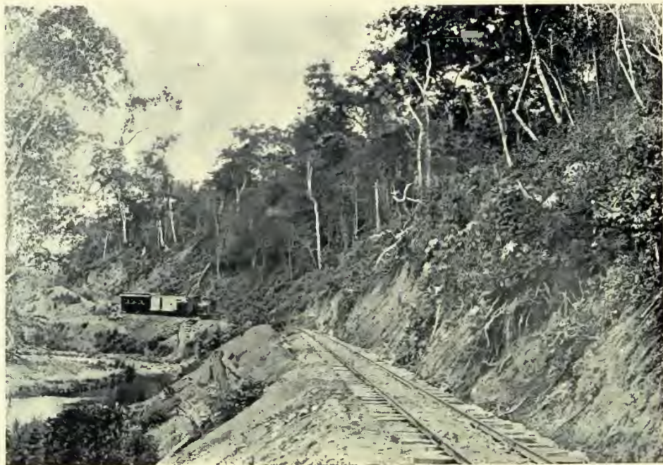
FERROCARRIL DEL NORTE—ORILLAS DEL RÍO MANAGUÁ.

quizá, la carestía de los jornales, la elevación de los cambios con los mercados extranjeros, el número de puentes y los variados y abundantes recursos de todo género que han debido importarse, se creería que las obras ejecutadas y la suma de intereses que á la empresa pertenecen tuvieran un gasto y un valor doble de los $7.859,859.14, que incluyendo la deuda ha costado la parte de línea construida. Su valor actual, según el estado de cosas y un justiprecio discreto é imparcial, no bajará de trece ó ca-