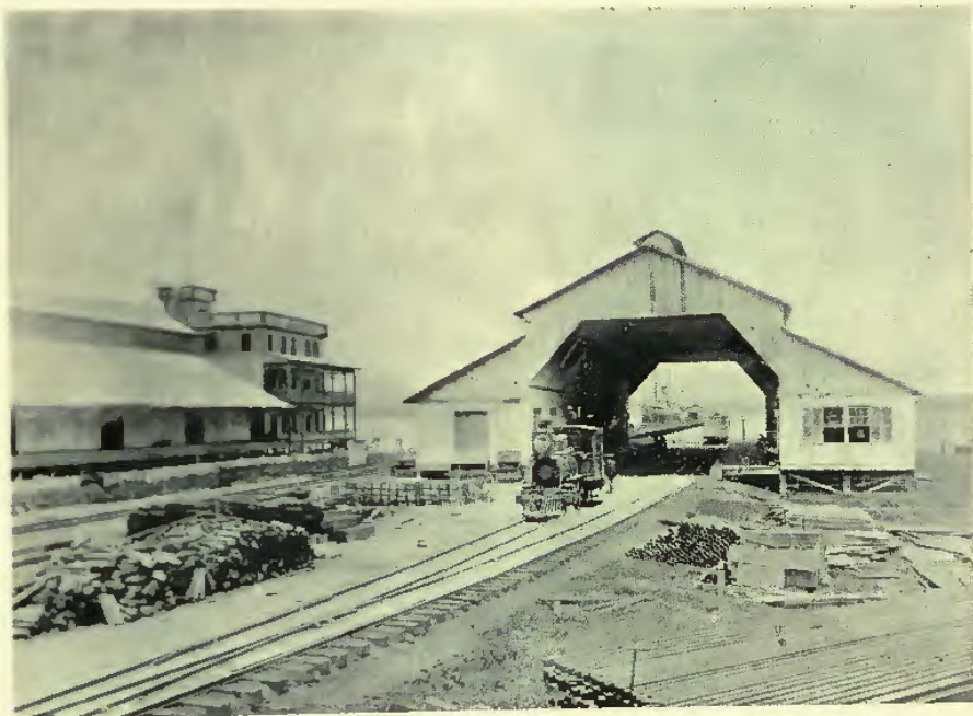
FERROCARRIL DEL NORTE—ESTACIÓN Y ADCANA DE PUERTO BARRIOS.

El Ferrocarril de Panamá y las demás líneas interoceánicas hicieron en el mundo un ruido extraordinario como si nada superior pudiera intentarse. Aquí sin muchas proclamaciones de la fama, vamos á concluir esa obra que por uno y otro motivo es superior á las demás de su género, no en gastos ni distancia, sino en condiciones y conveniencias. Más corta que el ferrocarril de California á New York; mejor cien veces por la salubridad, por el clima, por la estética, por la solidez, que el Ferrocarril de