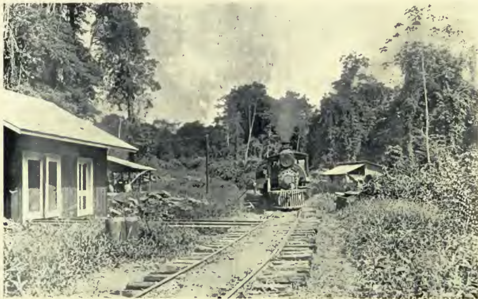
FERROCARRIL DEL NORTE — CASA DE SECCIÓN.

La extensión total de la línea hasta Guatemala, por el derrotero ya resuelto de Panajax, es de ciento noventa y seis millas y nueve décimos, en estas etapas: De Puerto Barrios á Tenedores, diez y ocho millas: de Tenedores á los Amates, cuarenta millas y ocho décimos: de los Amates á Gualán, veintiuna millas: de Gualán á Zacapa, veintiuna millas un décimo: de Zacapa al Rancho de San Agustín, treinta y cuatro millas: del Rancho á Panajax, treinta