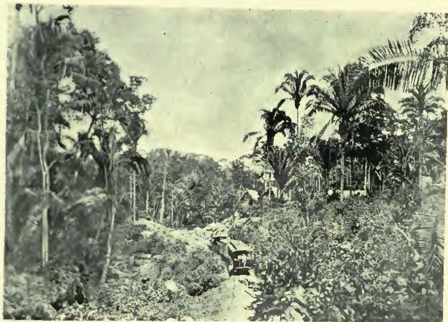
FERROCARRIL DEL NORTE—EL BOSQUE VIRGEN.

de segunda clase, ciento quince carros de plataforma, treinta carros de cajón, tres carros de equipaje, dos carros de guía á vapor, cuatro manguetas, dos velocípedos de inspección, cuatro carritos de empuje, ocho trucks, todo de calidad superior, con frenos de aire comprimido sistema Westinghouse, automáticos. Agréganse las estaciones en número de diez y siete desde Puerto Barrios al Rancho de San Agustín, con sus dependencias y oficinas, útiles y mobiliario, ya provistas unas, ó por proveer dentro de las