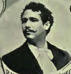
RAFAEL SPINDOLA ILUSTRACION