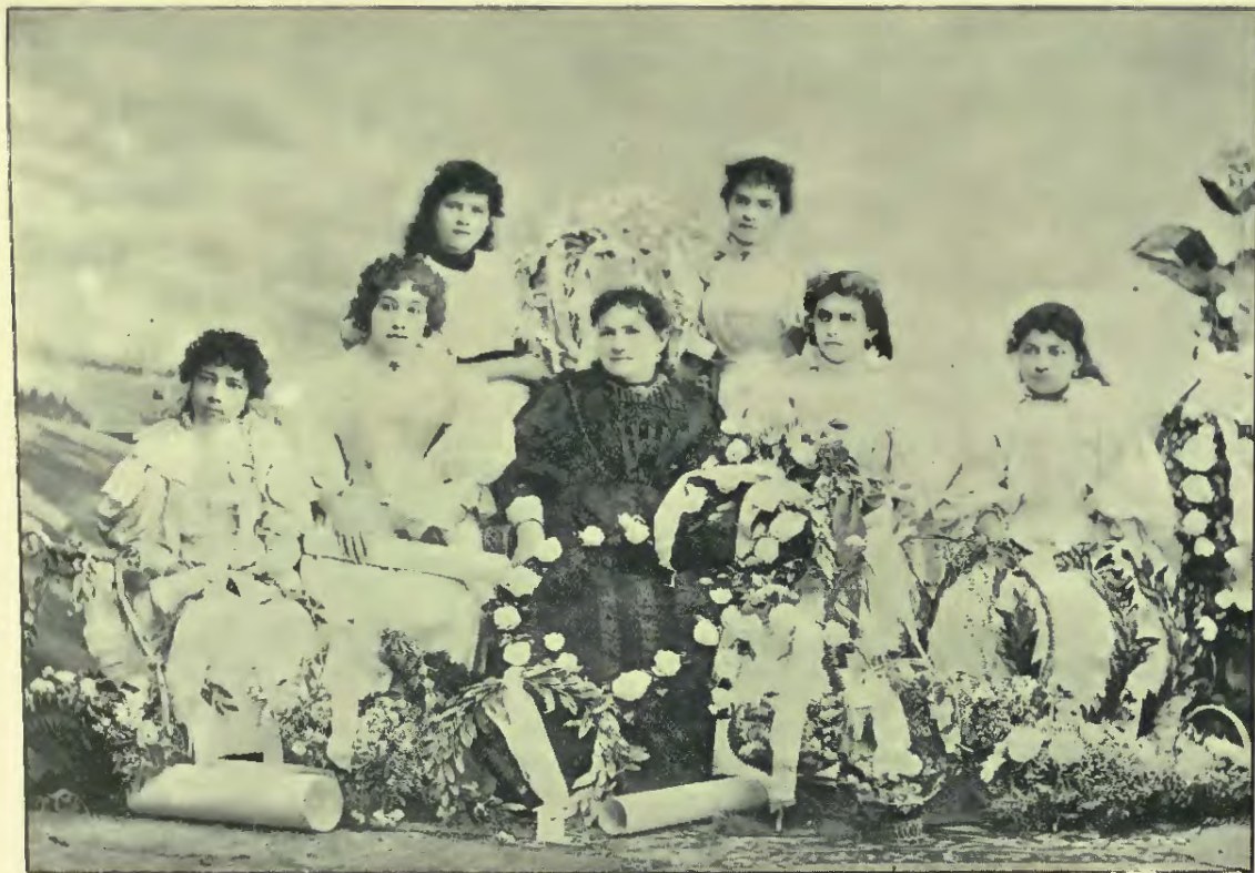
PROFESORAS TITULADAS EN LA ESCUELA NORMAL CENTRAL EN EL AÑO DE 1896.